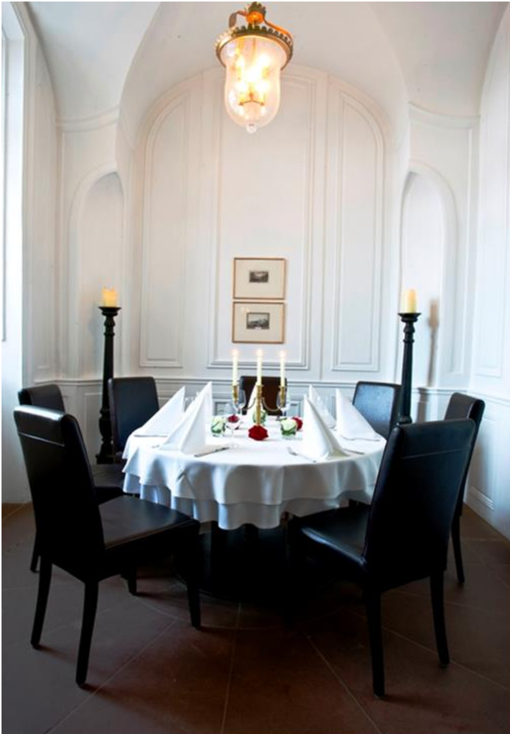
Fürstenzimmer des Restaurants im Biebricher Schloss in Wiesbaden – Biebrich